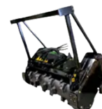
Hydraulické nůžky Kleště Čistící kartáč Štěpkovač