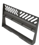
Nůžky na dřevo Vidlicový rám