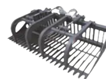
Sněžný pluh Lžice s čističem Kladivo Hrabací kleště