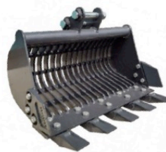
Lžíce prosévací 500mm