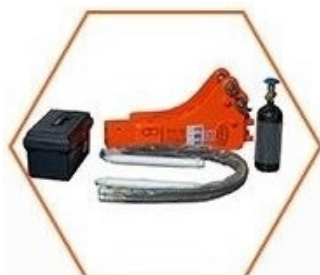
Hydraulické kladivo EDT 100