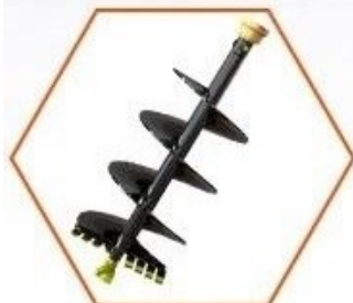
Půdní vrták 200