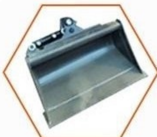
Hydraulická svahová lžice 800mm