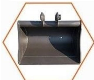
Svahová lžice 500mm